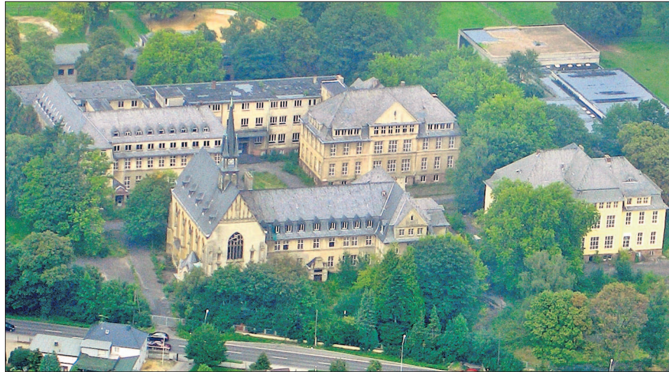
Im linken Teil des Gebäudekomplexes der ehemaligen Provinzial Heil- und Pflegeanstalt Waldniel befand sich die berüchtigte „Kinderfachabteilung“.

Andreas Kinast (45), zu Hause in Kempen, hatte 2002 die Leitung der Geschäftsstelle der Sparkasse in Waldniel übernommen und kam jeden